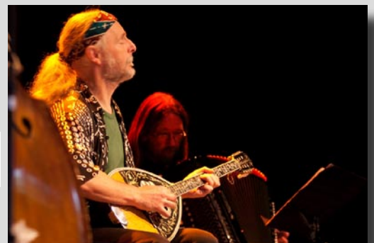
Kaj på Hijazz i Uppsala